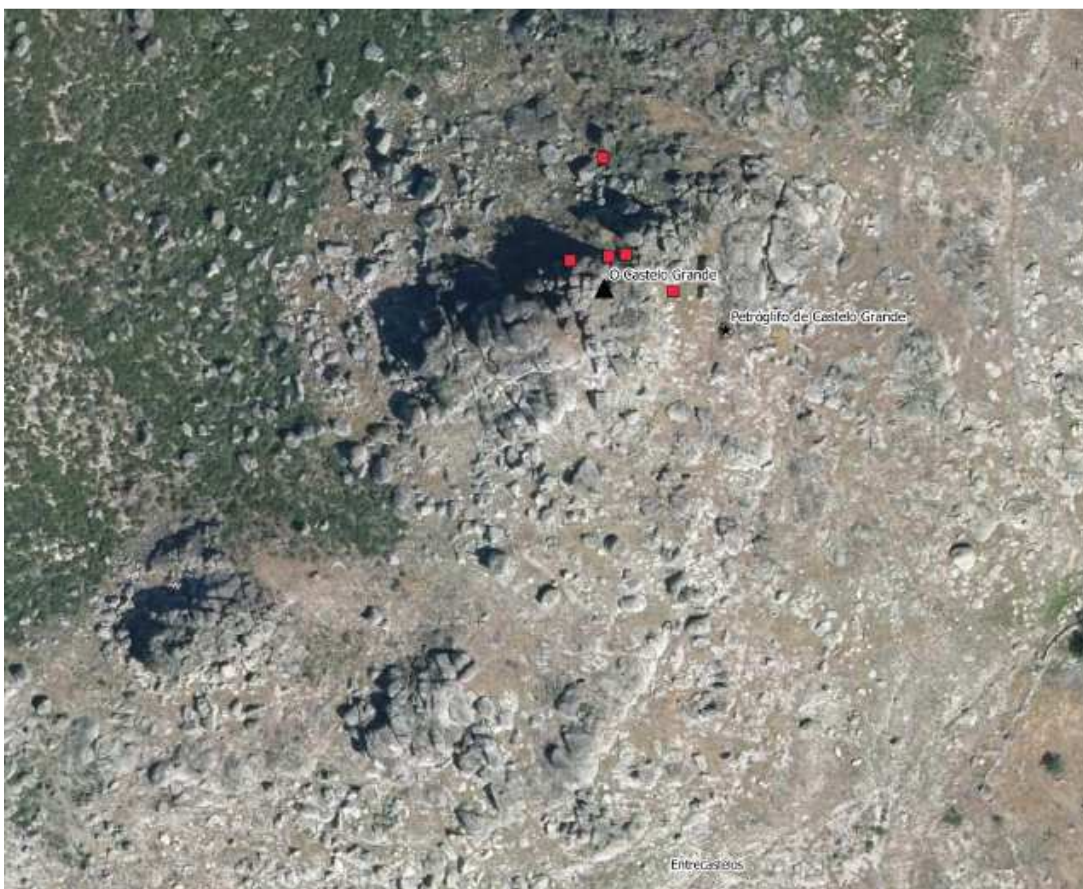
Imaxe 1 Diferentes puntos onde se localizou a cerámica

Non localizamos ningún alicerce de estrutura en superficie despois de aplicar o sistema LIDAR, fotogrametría aérea e prospección intensiva pero localizamos abundante material cerámico en diferentes puntos do xacemento, cuxa adscripción cultural é medieval.